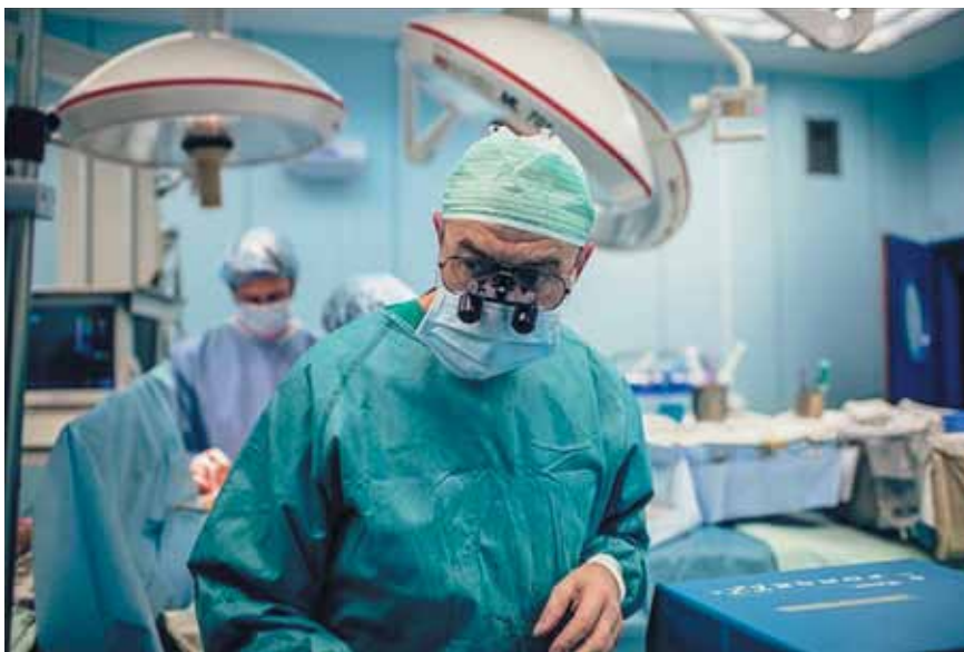
С.В. Готье в операционной

С.В. Готье выполнил первые в стране трансплантации комплекса «сердце–легкие», фрагмента поджелудочной железы, мультиорганые трансплантации (печени и почки, печени и поджелудочной железы), уникальную билобарную трансплантацию легких ребенку.