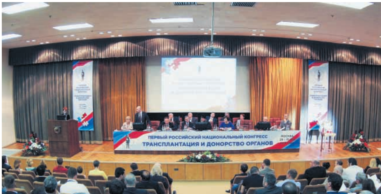
29–31 мая 2013 года в Москве состоялся Первый российский национальный конгресс «Трансплантация и донорство органов»

29–31 мая 2013 года в Москве состоялся Первый российский национальный конгресс «Трансплантация и донорство органов». Это первое в нашей стране событие такого масштаба, в фокусе которого – обсуждение всего комплекса ключевых вопросов трансплантологии и регенеративной медицины, имеющих не только научное и практическое, но и огромное социальное, общественное значение. Конгресс организован в соответствии с Планом научно-практических мероприятий Министерства здравоохранения Российской Федерации на 2013 год, утвержденным приказом Минздрава России от 23 апреля 2013 года № 245.