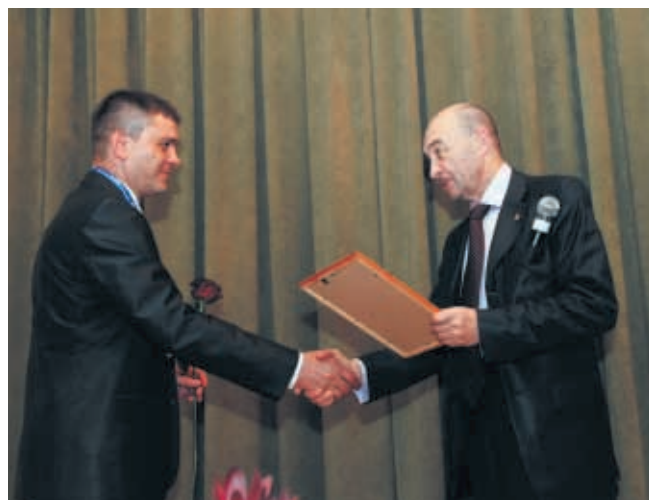
Все молодые ученые, представившие доклады, были награждены почетными дипломами

трансплантации почки при протяженном травматическом повреждении мочеточника.