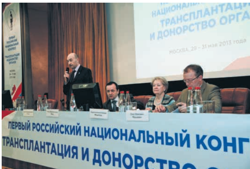
В рамках конгресса состоялся Первый российский образовательный форум «Трансплантология и донорство органов в программах высшего и дополнительного профессионального образования»

Стратегия развития предусматривает организацию донорства и трансплантации органов еще в 49–65 регионах, увеличение числа трансплантаций органов примерно в 10 раз, изъятий трупных органов до 3000–3500.