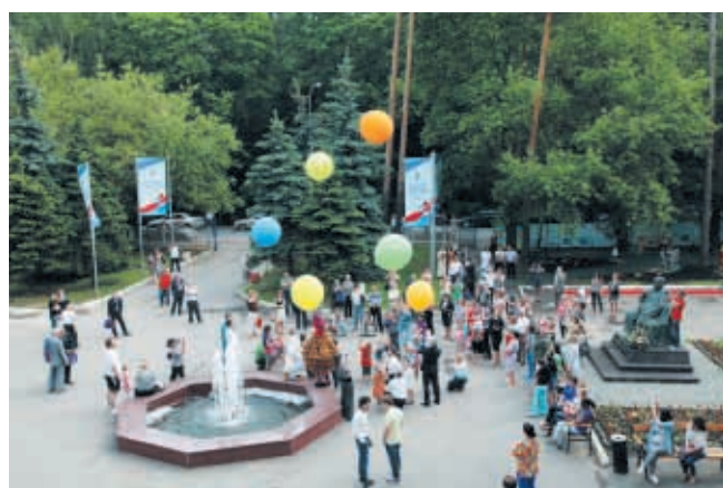
В последний день конгресса состоялась торжественная акция, посвященная Международному Дню защиты детей

Конгресс стал знаковым событием не только в профессиональной, научной, но также и в общественной жизни России, был широко освещен в средствах массовой информации.