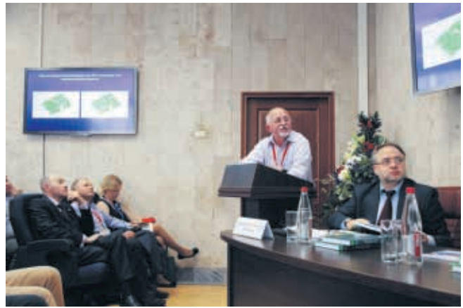
Рабочие моменты конференции «Регенеративная медицина и клеточные технологии»