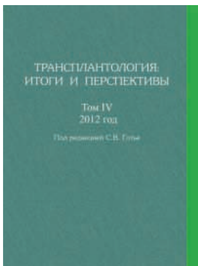
IV том фундаментального издания «Трансплантология: итоги и перспективы»

Участники конгресса получили очередной, IV том фундаментального издания «Трансплантология: итоги и перспективы».