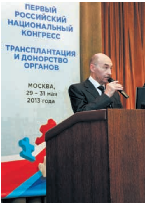
Открывая конгресс, председатель Российского трансплантологического общества академик РАМН С.В. Готье зачитал приветствие Президента РФ Владимира Владимировича Путина