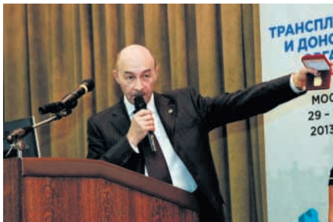
Почетным знаком «Дарящему часть себя» награждены родственные доноры почки и части печени, спасшие жизнь своих близких

Завершила церемонию открытия конгресса торжественная акция «Люди ради людей», безусловной эмоциональной и нравственной доминантой которой стало награждение за гуманизм и самопожертвование почетным знаком «Дарящему часть себя» родственных доноров почки и части печени, спасших таким образом жизнь своих близких.