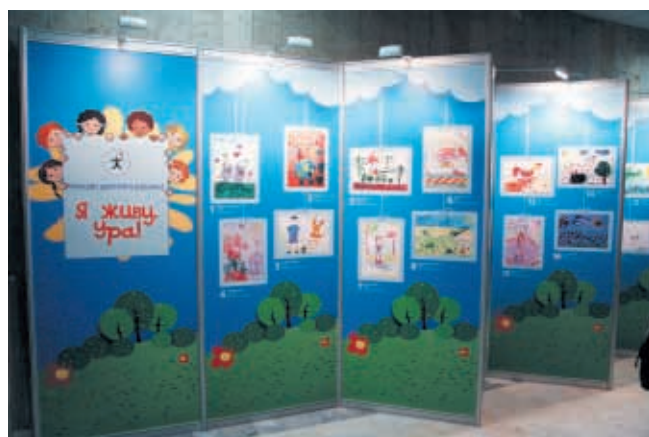
Выставка детских рисунков в финале конкурса «Я живу. Ура!»

На территории Центра была открыта и освящена иереем храма во имя преподобного Серафима Саровского при ФГБУ «Федеральный научный центр трансплантологии и искусственных органов имени академика В.И. Шумакова» Минздрава России уникальная художественная игровая площадка – «Уголок доктора Айболита».